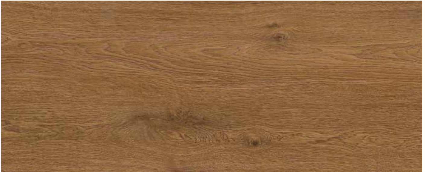
Ginger Wood Camel 80003956 1225 x 195 x 8,5 mm