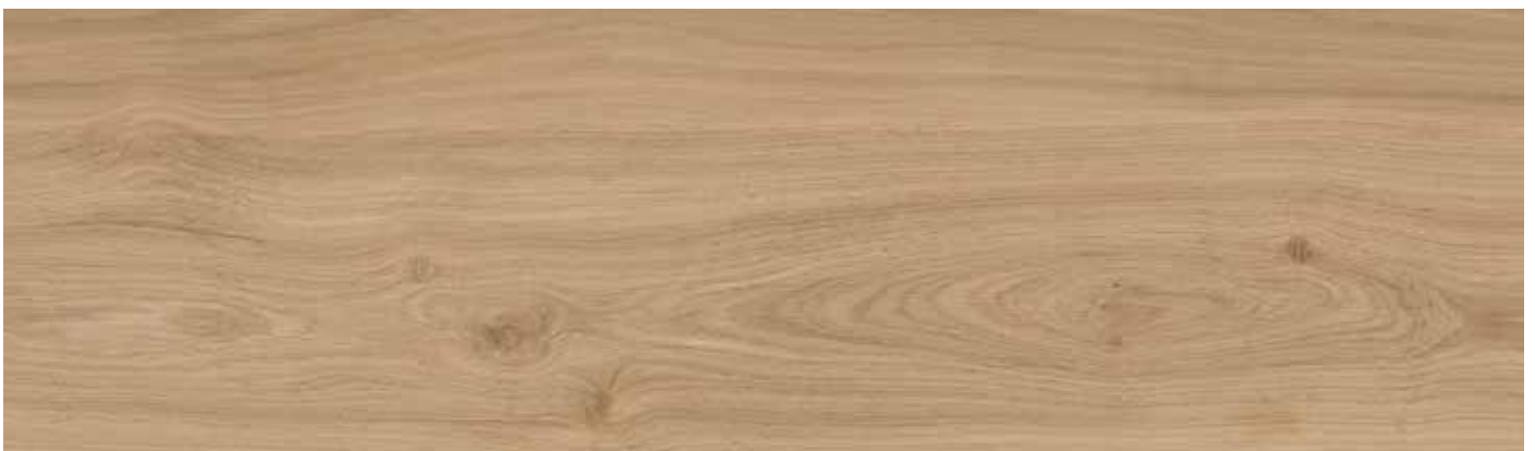
Natural Oak Almond 80003952 1225 x 195 x 8,5 mm