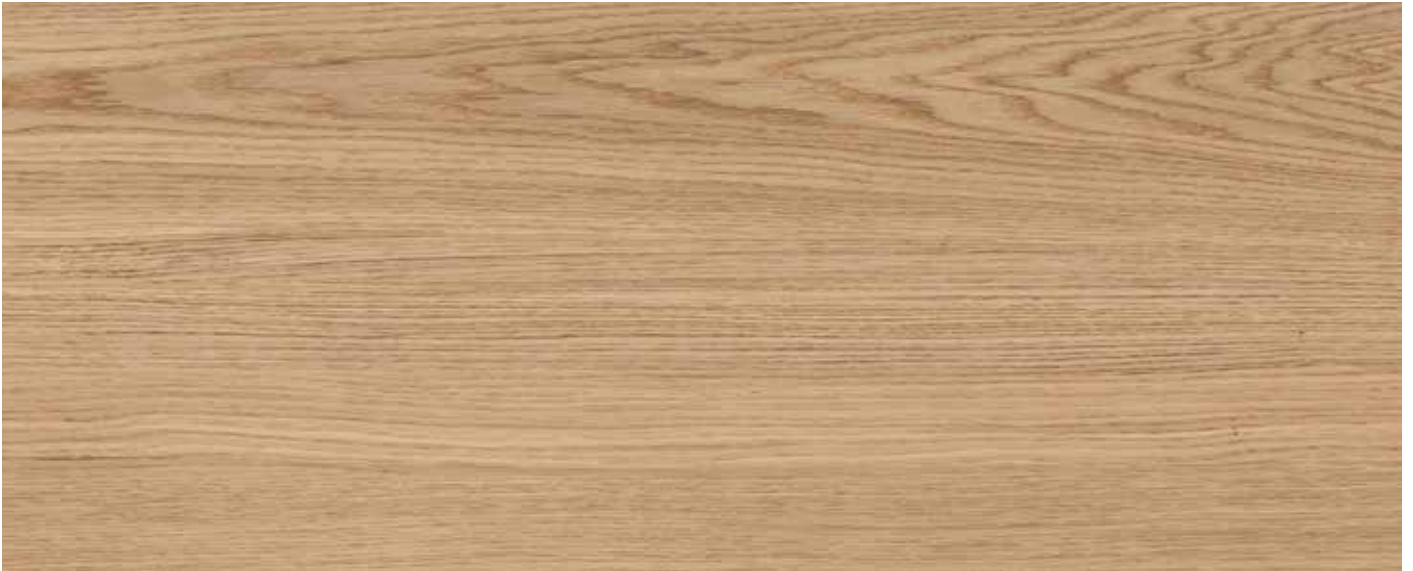
Pure Oak 80003925 1225 x 195 x 8,5 mm