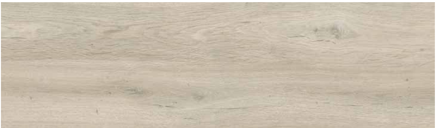
Dakota Oak Greyge 80003949 1225 x 195 x 8,5 mm