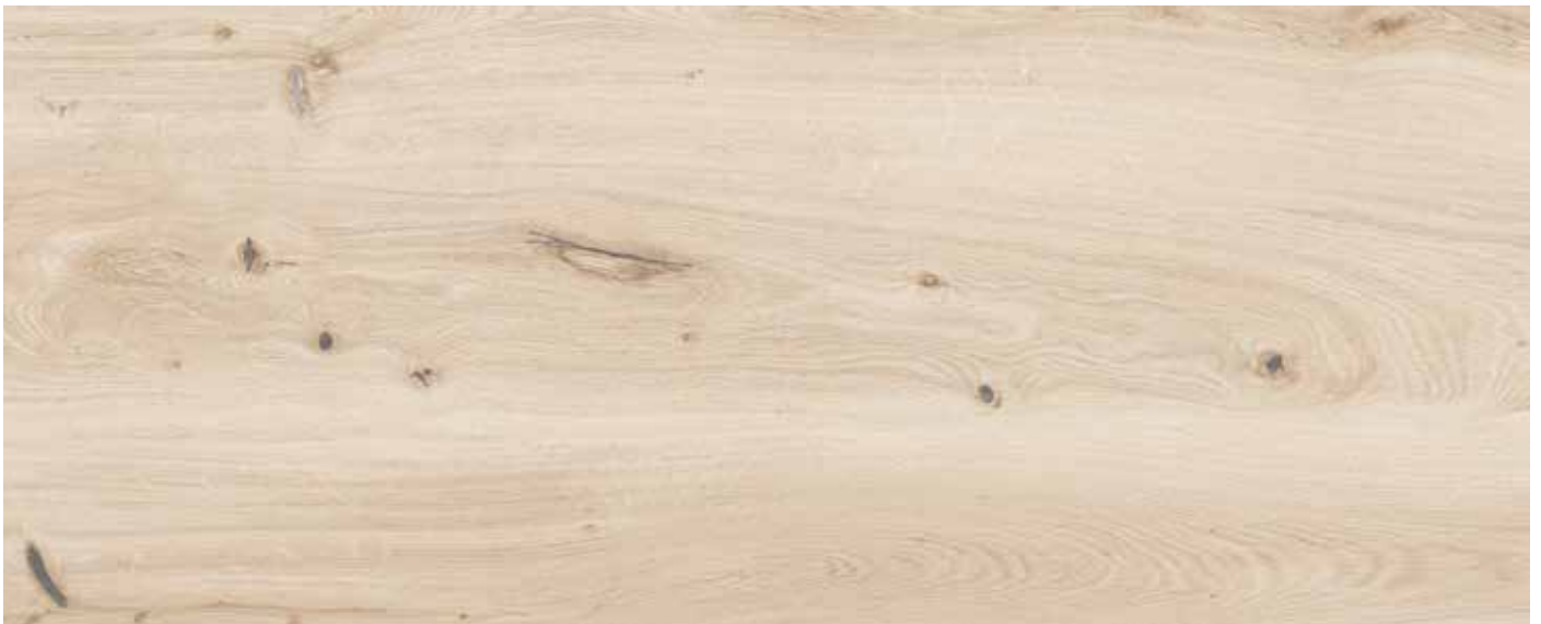
Panama Oak Light Sand 80003943 1225 x 195 x 8,5 mm