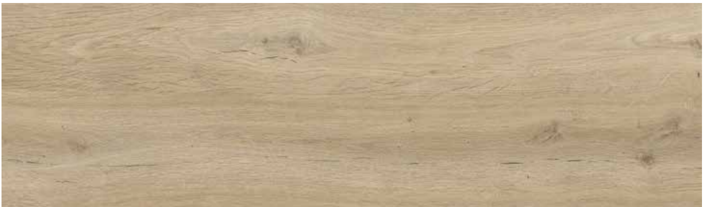
Dakota Oak Sand 80003948 1225 x 195 x 8,5 mm