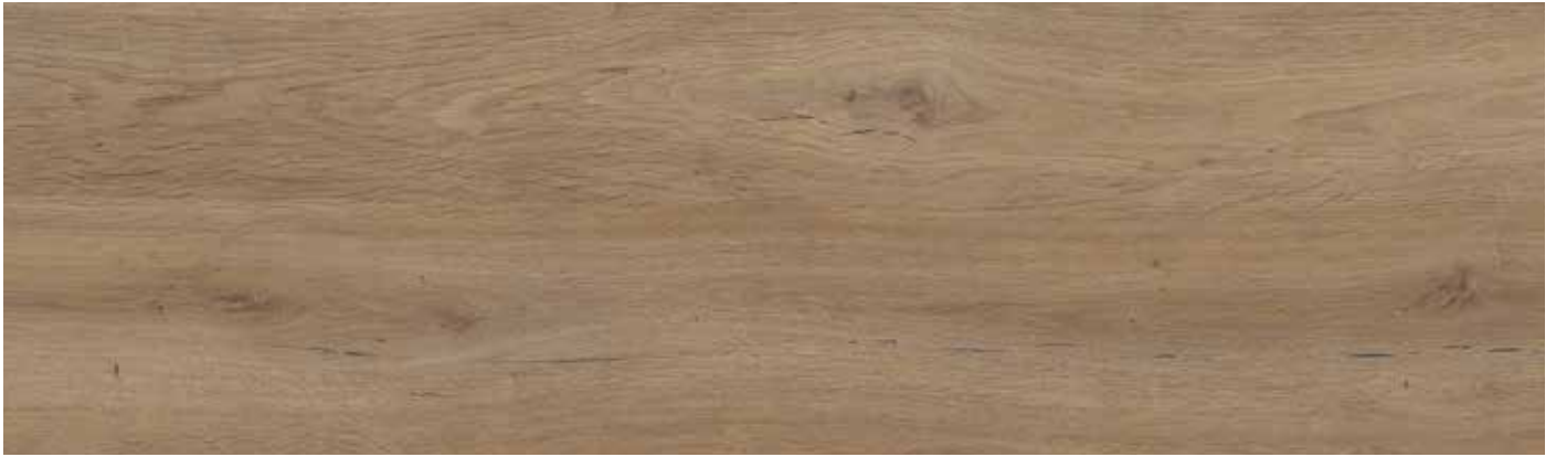
Dakota Oak 80003947 1225 x 195 x 8,5 mm