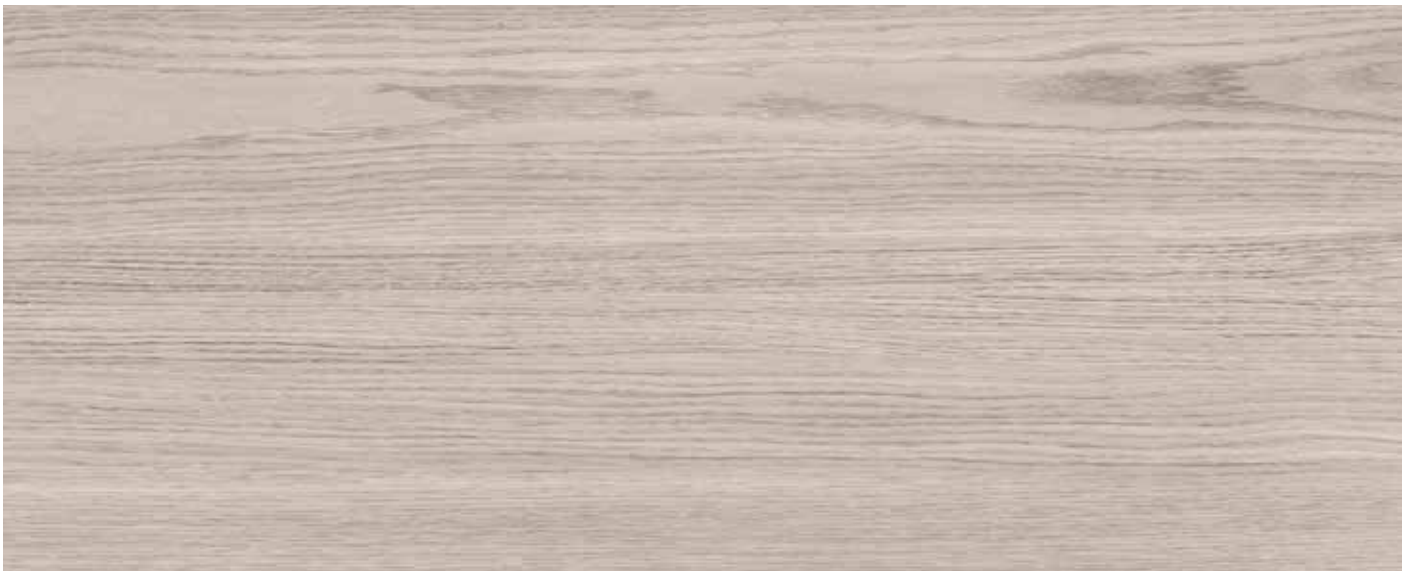
Pure Oak Grey 80003926 1225 x 195 x 8,5 mm