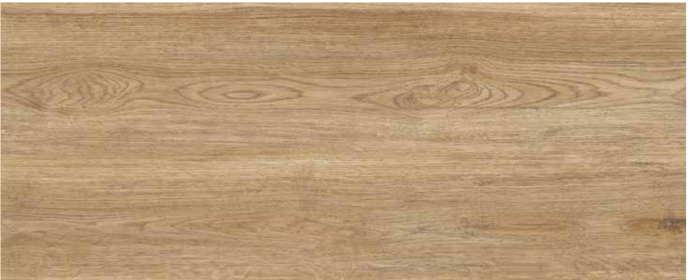
Ariana Oak 80003930 1225 x 195 x 8,5 mm