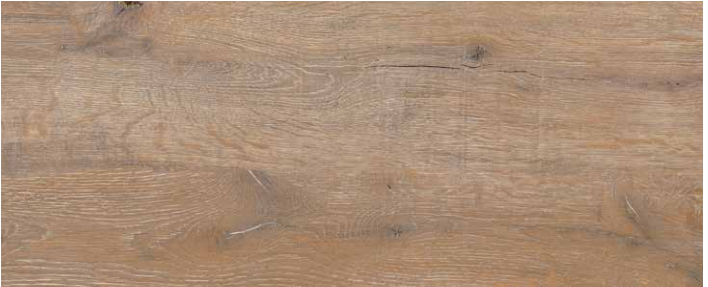
Farina Oak Savannah 80003928 1225 x 195 x 8,5 mm