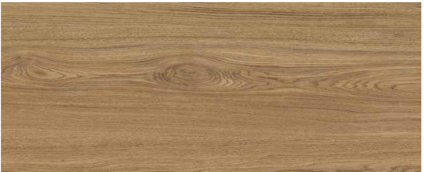
Epoca Oak Dark Almond 80003924 1225 x 195 x 8,5 mm