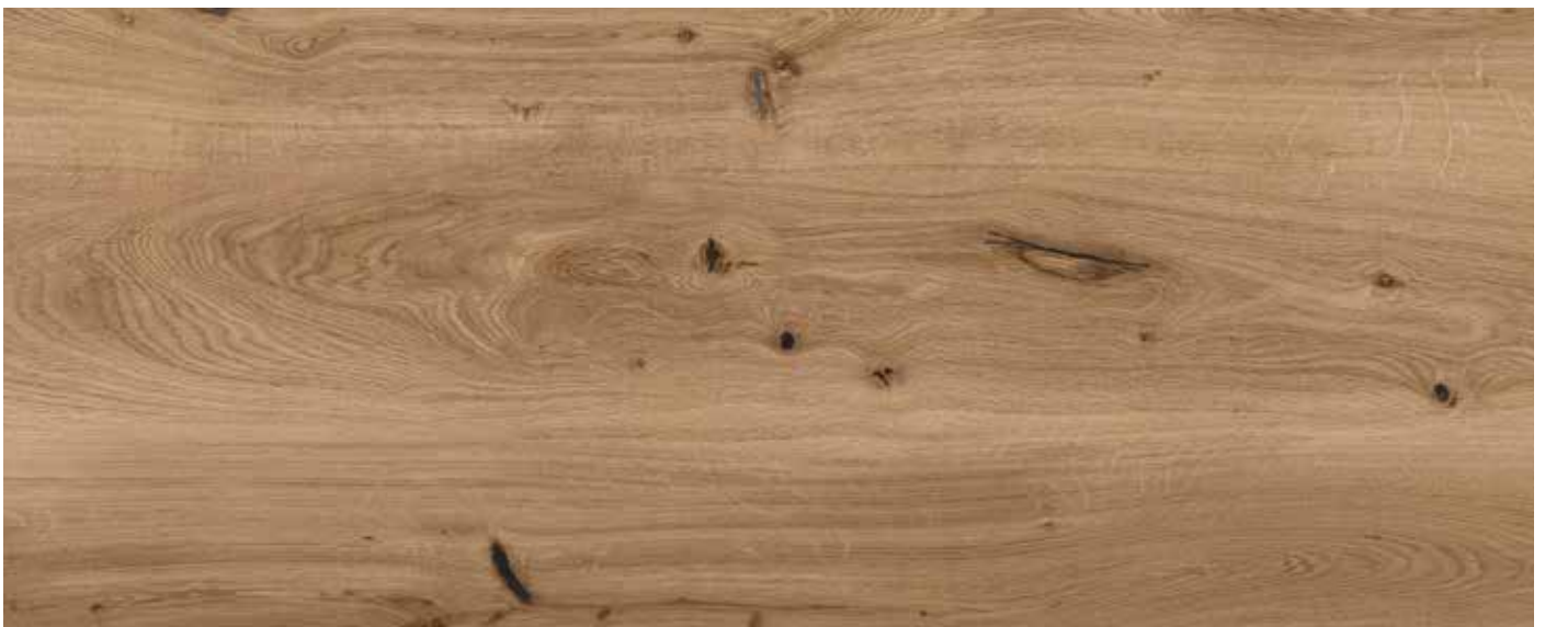
Panama Oak Cognac 80003945 1225 x 195 x 8,5 mm