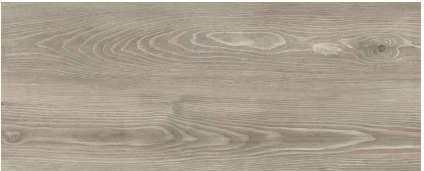
Smoke Oak Grey 80003935 1225 x 195 x 8,5 mm