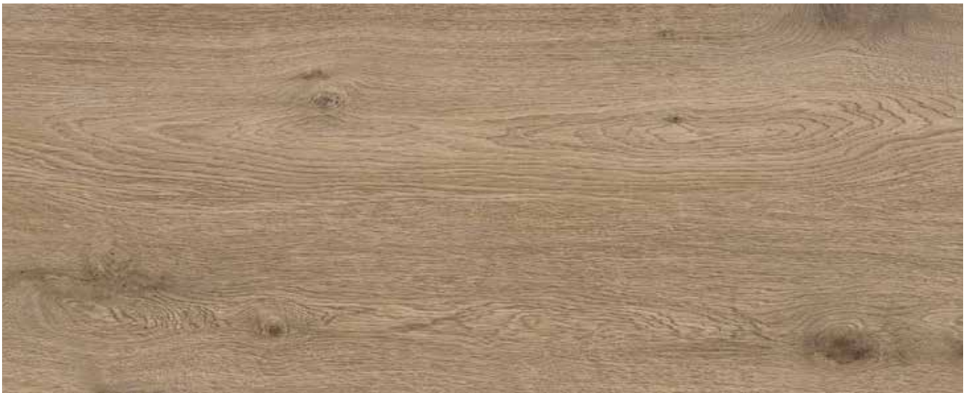
Ginger Wood Fume 80003957 1225 x 195 x 8,5 mm