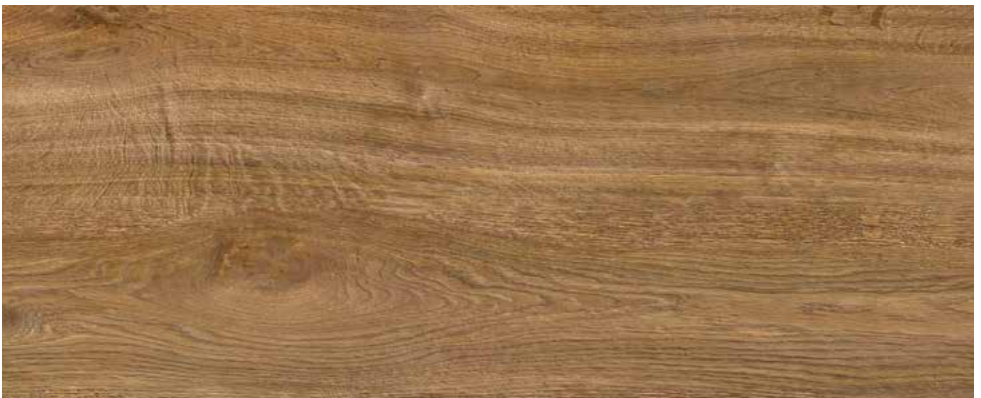
Antique Oak Honey 80003968 1225 x 195 x 8,5 mm