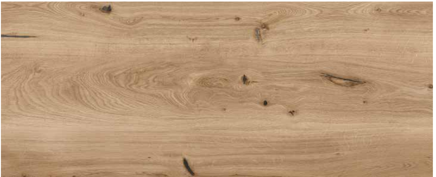
Panama Oak 80003942 1225 x 195 x 8,5 mm